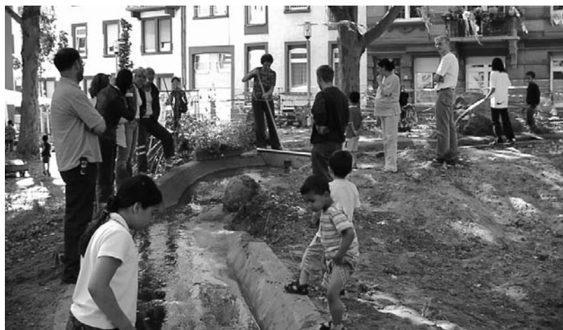
– Gemeinschaftsgärten sind eines von vielen Beispielen für die soziale Nutzung von Boden.

„Der nächste Krieg wird um Trinkwasser geführt“ – derlei Einschätzungen bringen das Gemeingut Wasser ins öffentliche Bewusstsein. Die Klimadebatte bewirkt das Gleiche mit dem Gemeingut Luft. Nur beim Boden erwacht das Bewusstsein, dass es sich auch hier um eine wertvolle Ressource handelt, die allen Menschen gehört, erst zaghafte. Dabei gibt es in der Gesellschaft eine fühlbare Grundstimmung dazu: Ob man sich auf Karl Marx, Häuptling Sitting Bull, Rudolf Stei-