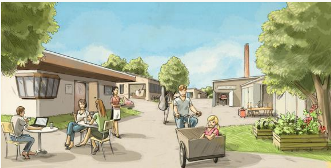
Illustration von Matthias Seifert, Weimar

Konkret hat die Stiftung die 4.800 m 2 Boden gekauft, finanziert zum Teil aus einer großzügigen Zustiftung und zum Teil aus eigenen Mitteln. Mehr Informationen .