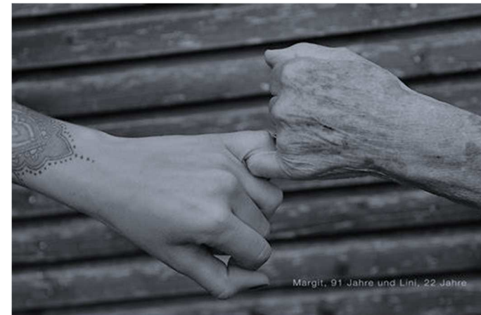
Abbildung 2: respekt.net