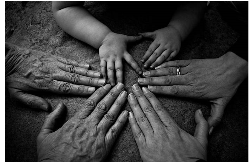
Abbildung 1: programm-altersbilder.de